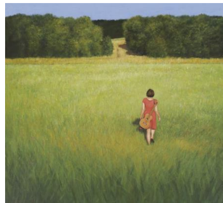
Thema: Religie in ons midden Beeld: Wouter Berns - En Chemin (2017)