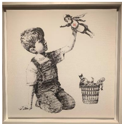
Thema: Zorg voor de Ziel Beeld: Banksy - Nurse Superhero (2021)