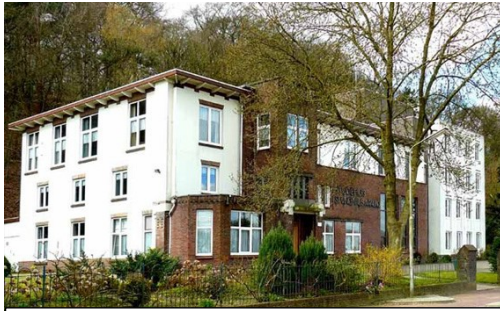
Het voormalige CM-studiehuis Vincentius a Paulo in Nijmegen nu een begeleid wonen-project voor jongeren.

Nijmegen het studiehuis Vincentius a Paulo zou worden verkocht. Het zou een verarming zijn wanneer de naam van deze sociale inspirator uit de stad zou verdwijnen. Bij die wens ligt het begin van Vincent de Paul Center NL. Na anderhalf jaar van enthousiast en pittig voorbereiden konden eind december 2012 de statuten van de nieuwe vincentiaanse stichting worden getekend.