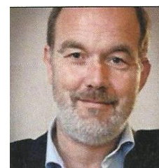
dr. Peter de Goede twitter-account