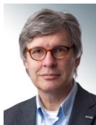
Peter Reijers Communicatie