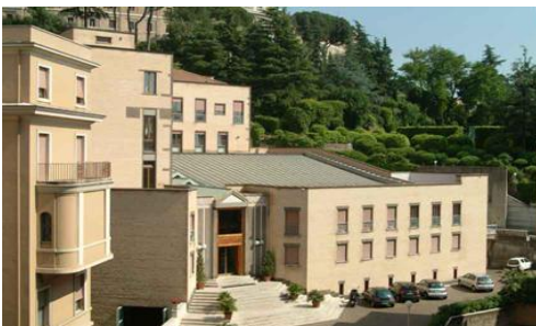
het Augustinianum, vlakbij het St. Pietersplein, waar de meeting plaats vond

De Vincentiaanse Familie is een veelkleurig internationaal netwerk van meer dan 150 verschillende organisaties waaraan in totaal zo'n 4 miljoen mensen op een of andere manier zijn verbonden. Op gezette tijden komen leidinggevendenden van deze organisaties bijeen om actuele ontwikkelingen te bespreken en toekomstplannen te ontwerpen.